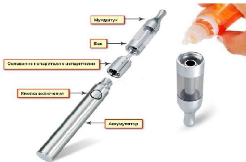
Рис. 3. Устройство электронной сигареты

Обычная электронная сигарета состоит из аккумулятора, электрического испарителя, емкости для жидкости, мундштука и дополнительных элементов для автоматического управления подачей ароматической жидкости (но последние имеются не во всех моделях), рис.3.