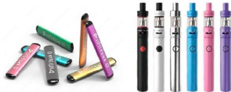
Рис. 5. Одноразовые (слева) и многоразовые (справа) электронные сигареты

Одноразовые ЭС рассчитаны на 200 - 500 затяжек пара. В многоразовых устройствах нет таких ограничений и они работают до тех пор, пока доливается жидкость в емкость.