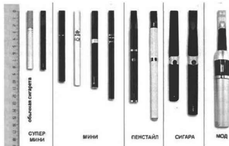
Рис.4. Типы и размеры электронных сигарет

Электронные сигареты (вейпы) классифицируются также по типу и размеру (рис.4) в соответствии с длиной (от 82 мм до 175 мм).