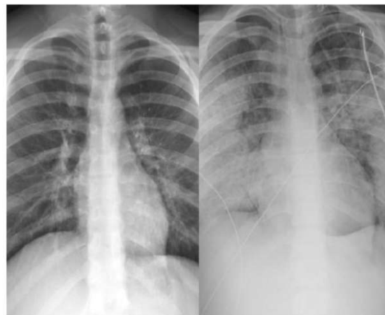
Рис.6. Здоровые легкие (слева) и легкие после 5 дней использования вейп-устройства

как: «Повреждение легких, связанное с употреблением электронных сигарет или продуктов вейпинга». Данное заболевание будет внесено в МКБ-11, а пока CDC рекомендует кодировать эту болезнь другими подобными заболеваниями. EVALI может отражать спектр болезненных процессов, а не один конкретный процесс. Отдельные сообщения о заболеваниях легких, связанных с вейпингом, описывают острую эозинофильную пневмонию, диффузное альвеолярное кровоизлияние, липоидную пневмонию, и респираторный бронхолит, ассоциированный с интерстициальным заболеванием легких (рис.6).