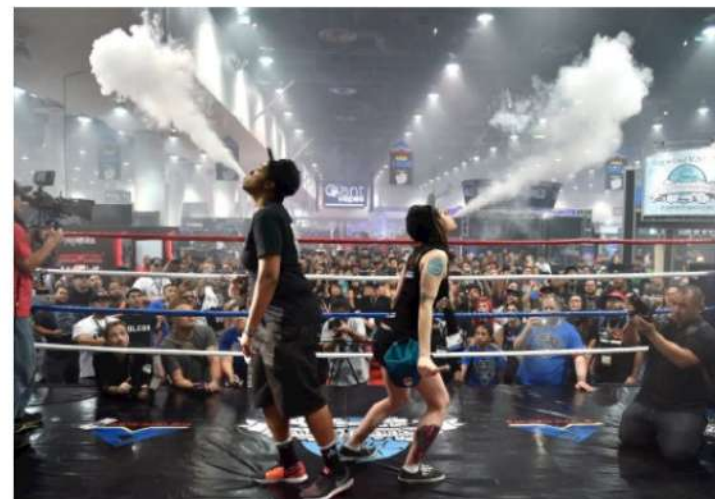
Рис. 2. Вейпинг соревнование

Быстрому распространению курения ЭС (вейпингу) способствуют компании-производители, которые превратили курение ЭС в целую субкультуру. В мире на регулярной основе проводятся субсидируемые компаниями-производителями выставки и соревнования среди курильщиков ЭС (рис.2). Это так называемые: «Cloudchasing» (мастерство выдувания облаков пара), «Tricks» (трюки с паром) и «Вейпинг-алхимия» (соревнования по составлению новых жидкостей для вейпа).